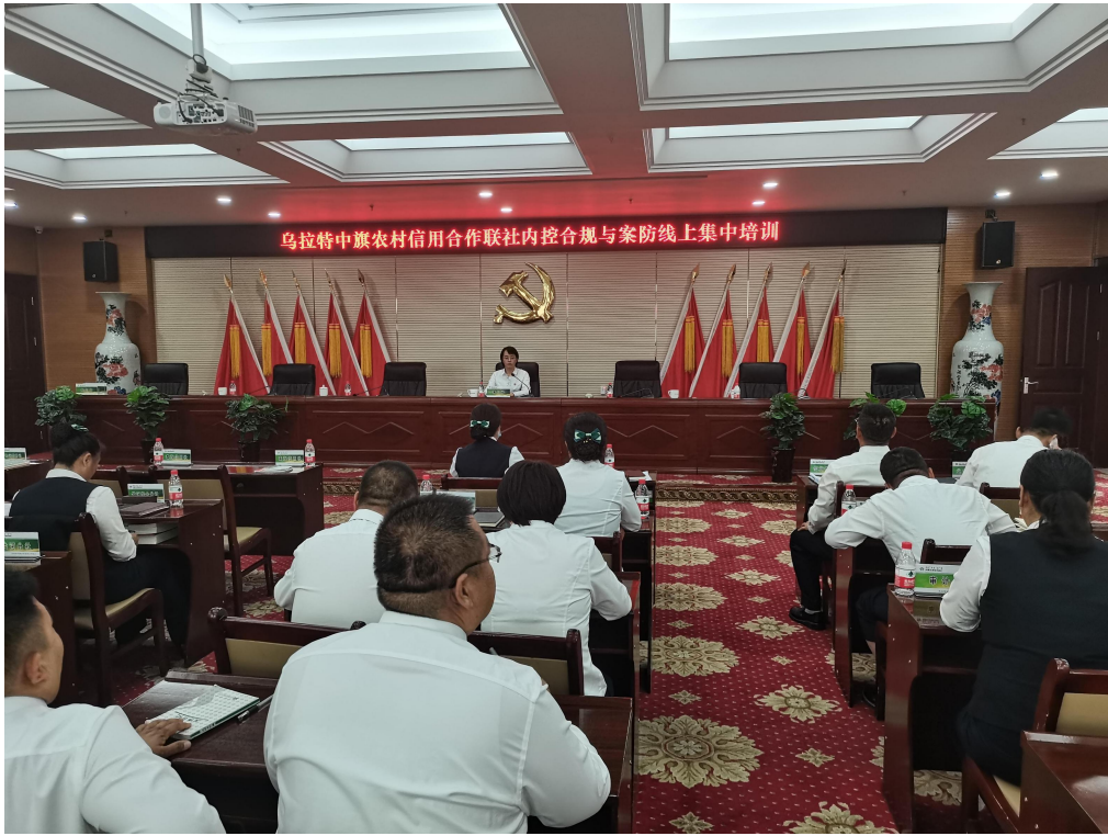
乌拉特中旗联社集中观看