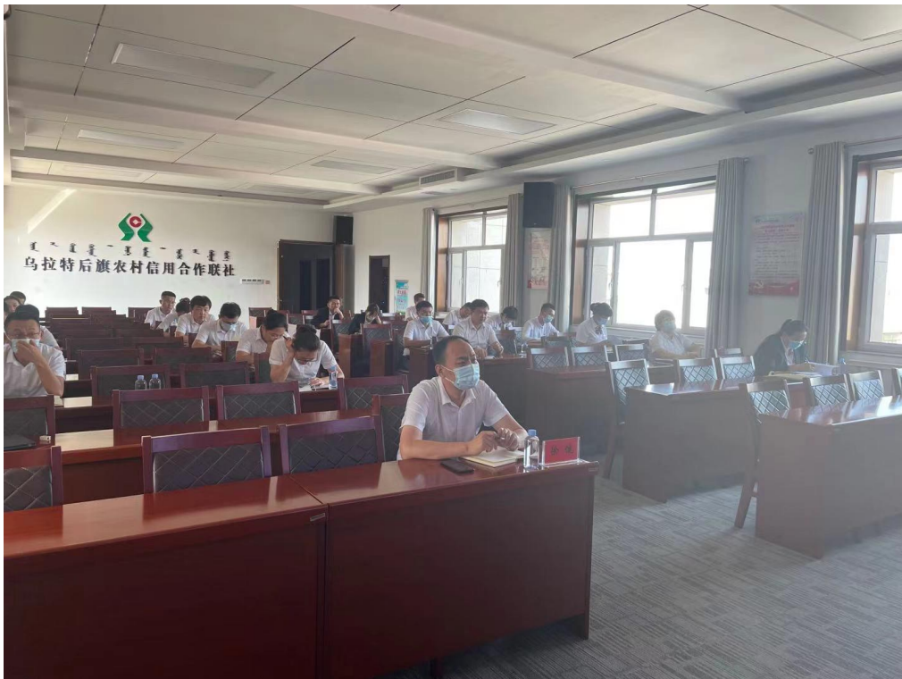
乌拉特后旗联社集中观看