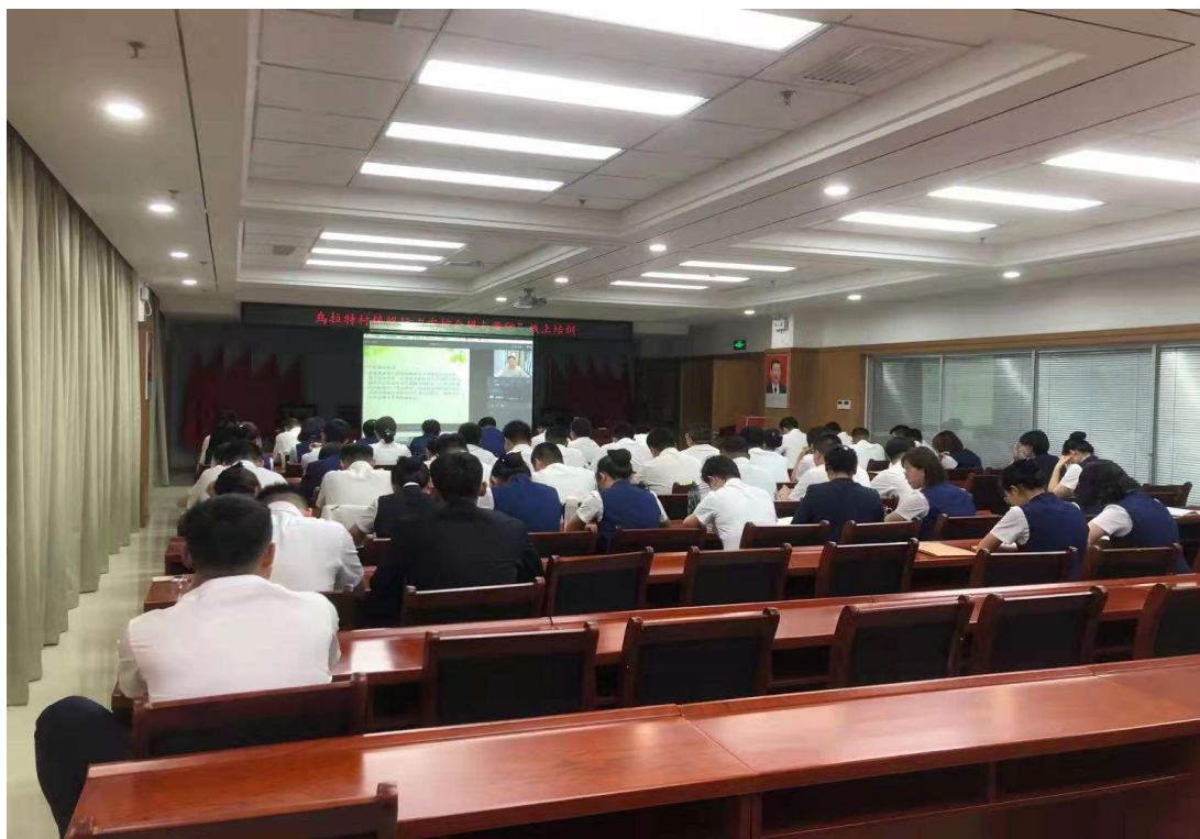
乌拉特村镇银行集中观看