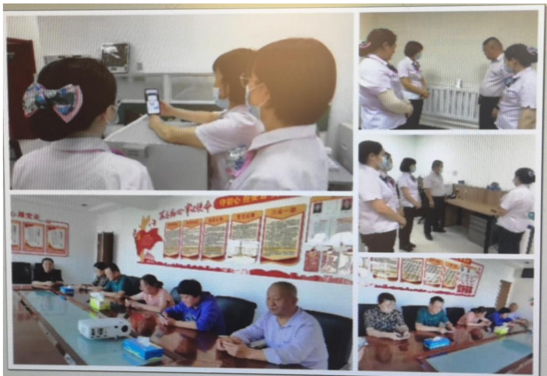
农业银行各部门学习