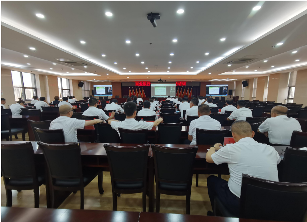
河套农商银行集中观看