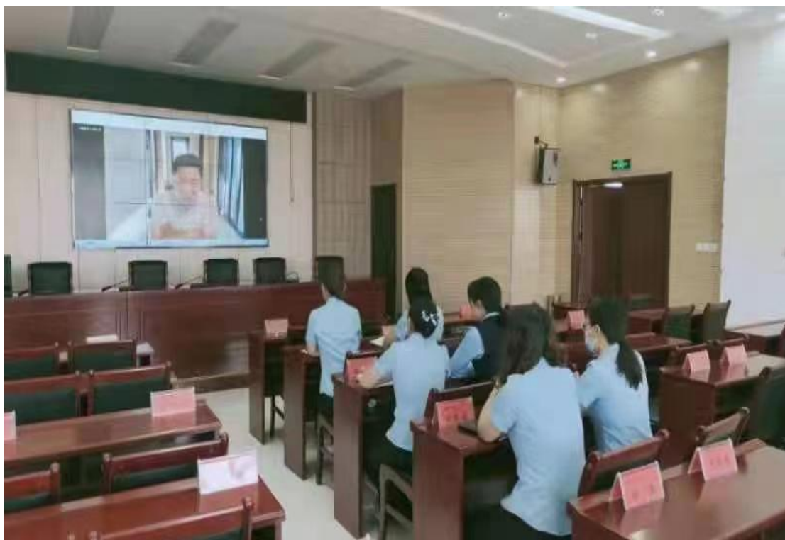
磴口蒙银村镇银行集中观看