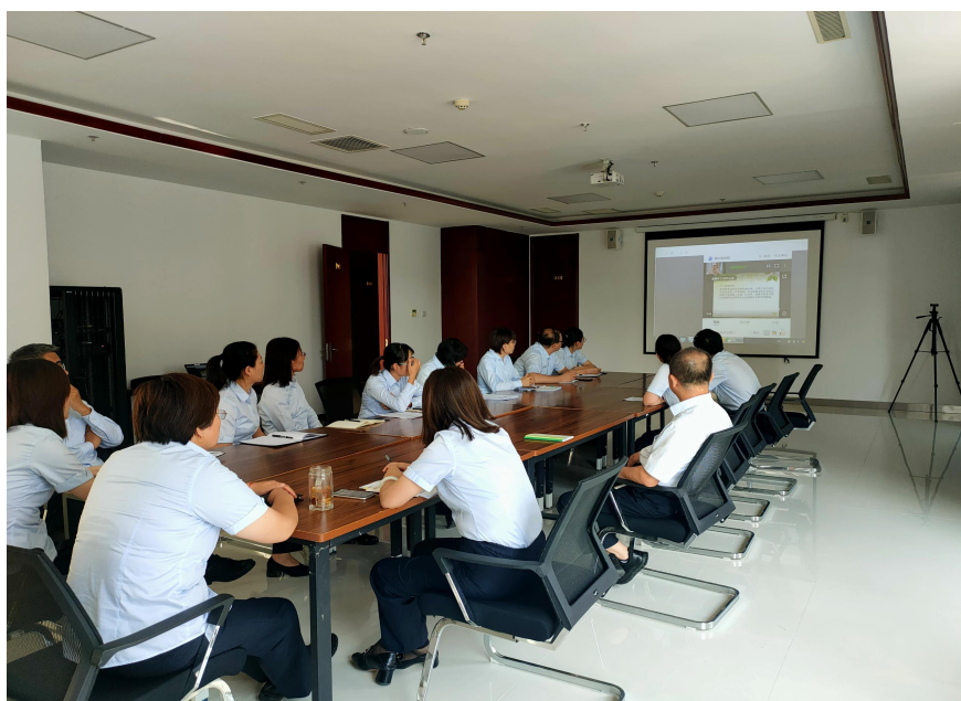
中国银行集中观看