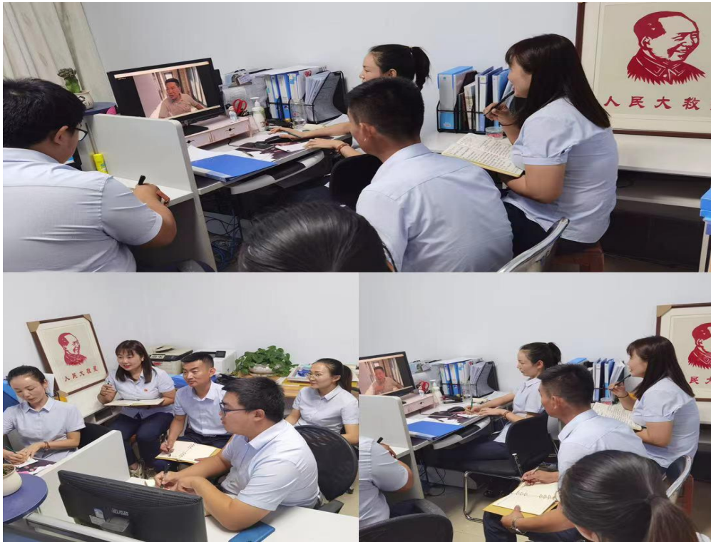
五原蒙银村镇银行部门集中学习