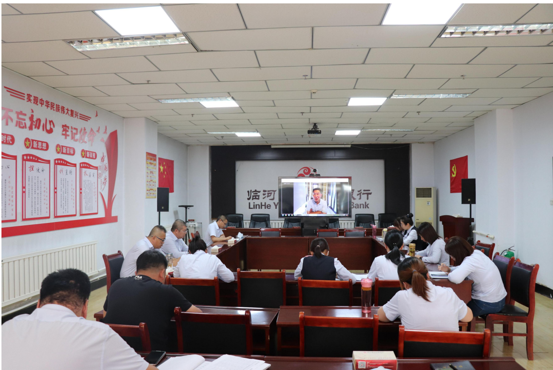
临河黄河村镇银行集中观看