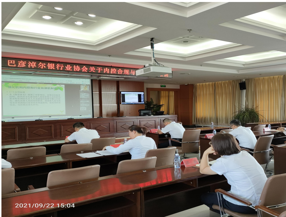
五原农商银行集中观看