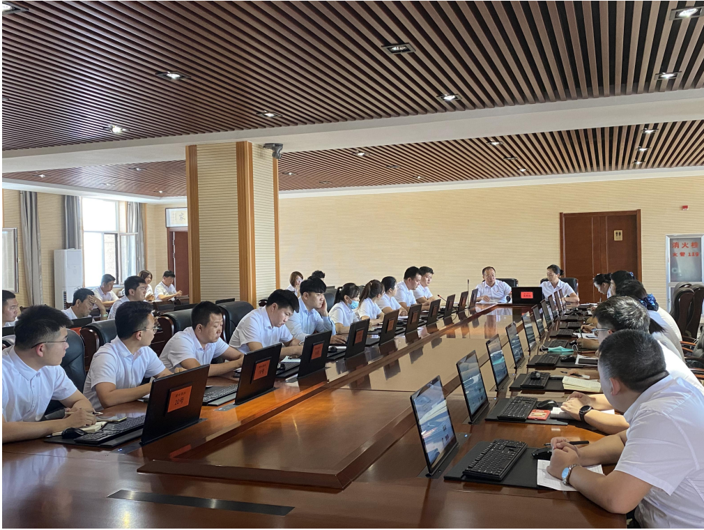
磴口县联社集中观看