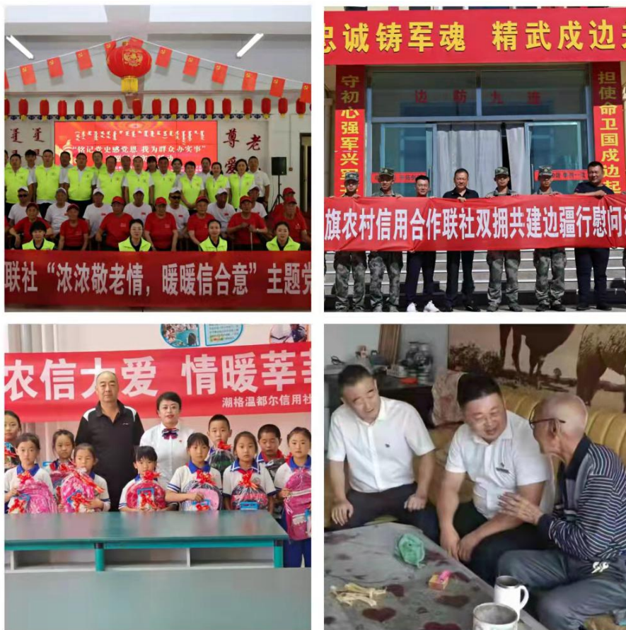
乌拉特后旗联社党委组织开展系列慰问活动