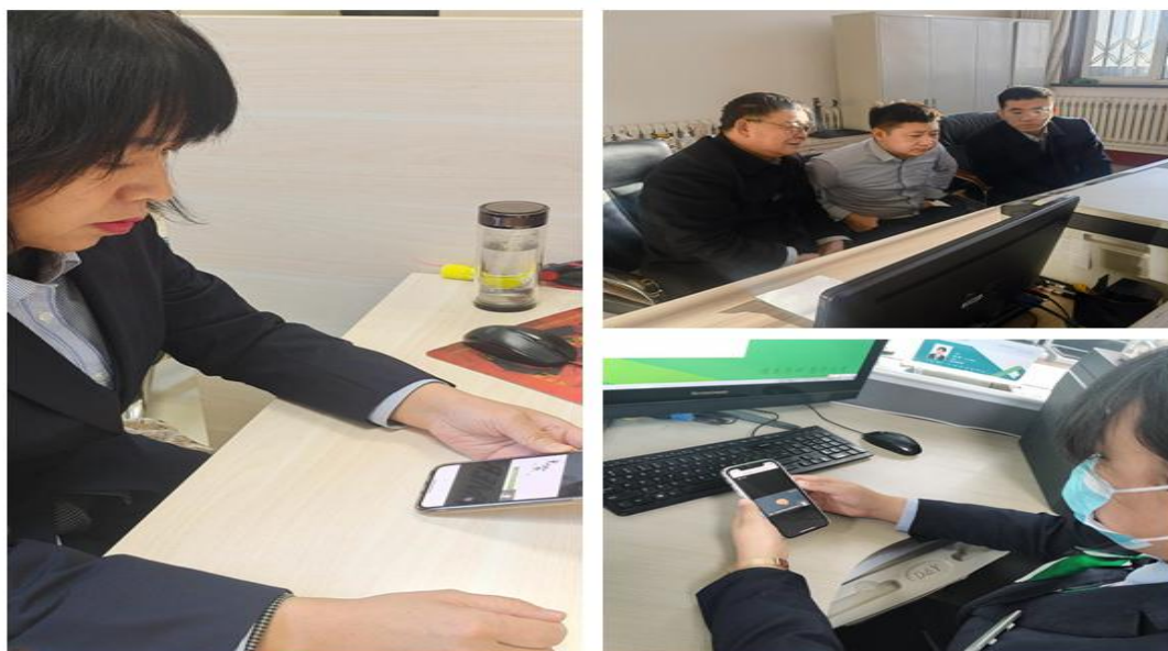
陕坝农商银行组织分支行学习