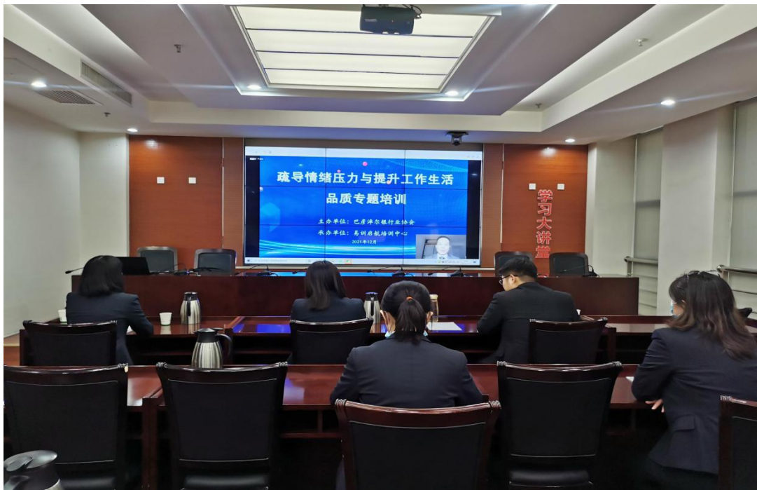
河套农商银行集中观看