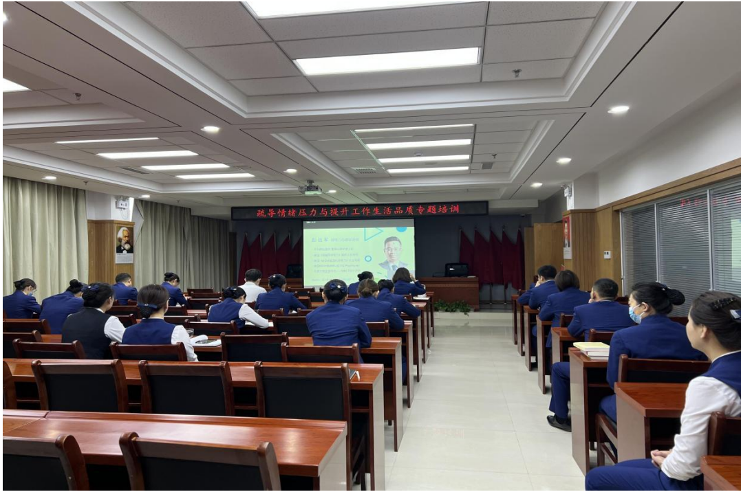
乌拉特村镇银行集中观看