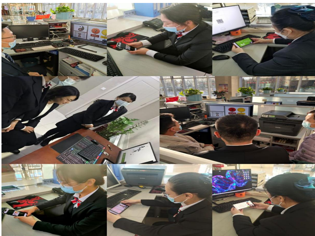
磴口县联社组织分支机构学习