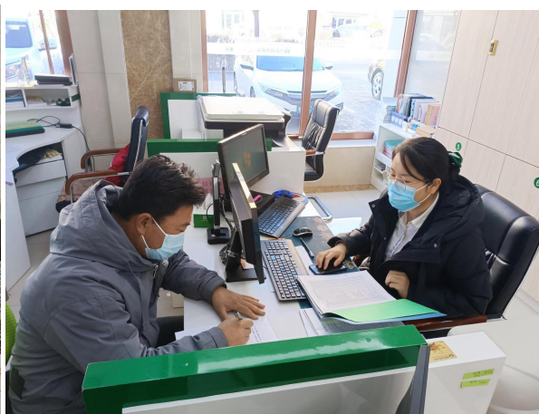
（右：营业网点办理贷款）